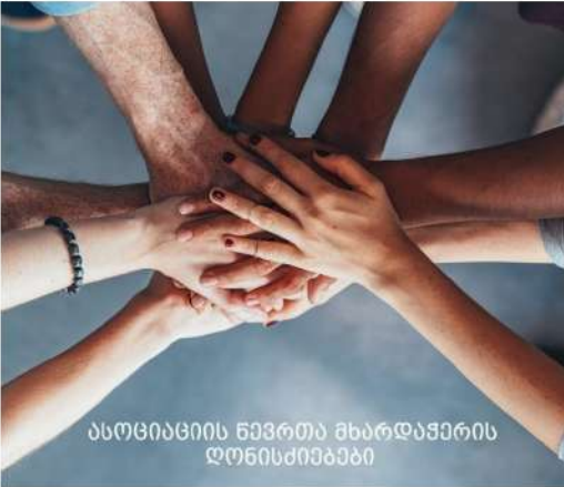
ასოციაციის წევრთა მხარდაჭერის ღონისძიებები